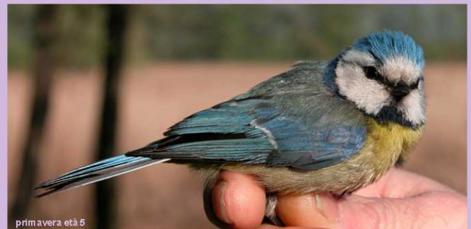
primavera età 5

Nel giro di controllo alle reti delle ore 10 del 24 ottobre 2005, insieme a poche altre catture, c'era anche una “ennesima” ricattura di Cinciarella; la lettura dell'anello però ci ha riservato una sorpresa, talmente poco credibile che chi stava compilando le schede di campo, prima di scrivere il dato, ha voluto controllare di persona l'anello: VT59062 Mus. Zool. Lithuania. Inoltre, al momento di inserire i dati nel programma Nisoria, ci siamo “trovati” una Cinciarella ricatturata il 13 settembre che non era nostra ma proveniente, sembra, dal Cuneese.