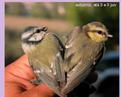
autunno, età 3 e 3 juv