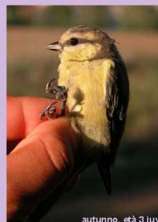
autunno, età 3 juv

Se ne deduce che il dato della Cinciarella lituana catturata a Fondotoce non rappresenta una novità e neanche un record di distanza ma sicuramente ribadisce l'importanza di porre la dovuta attenzione e riconoscere le legittime aspirazioni anche per quelle specie da noi ritenute più comuni e “poco significative”.