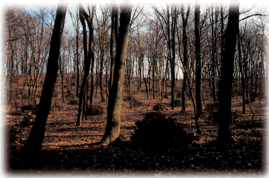
Cataste di legna ai Lagoni.

I risultati ottenuti hanno determinato la comunità locale di Borgoticino a chiedere che l'Ente Parchi gestisca una nuova area protetta: la Riserva naturale orientata del Bosco Solivo.