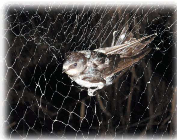
Rondine ( Hirundo rustica ) nella rete

Nella riserva di Fondotoce, lungo una delle rotte di migrazione che collegano l'Africa al Nord Europa, si trova il Centro Studi sulle Migrazioni, realizzato nell'ambito di un progetto comunitario (Interreg II-III). Il Centro è attrezzato con una passerella galleggiante di 300 metri che attraversa il canneto alla foce del fiume Toce, area di sosta per molti stormi in migrazione.