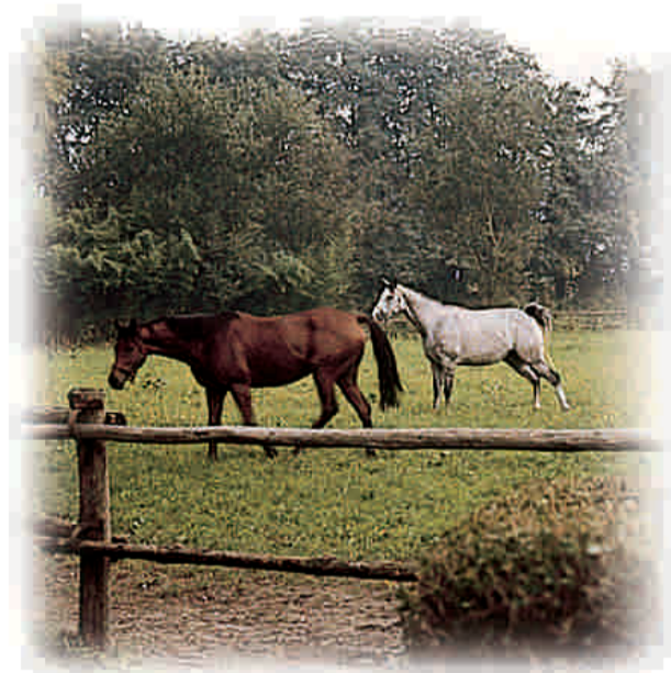
Cavalli al pascolo a Villa Tesio

Nella Riserva dei Canneti di Dormelletto, nascosta alla vista da un groviglio di insediamenti residenziali, produttivi e commerciali lungo la statale del Sempione, si pratica da oltre un secolo l'allevamento di cavalli da corsa. Questo fu iniziato dal "Mago di Dormello", Federico Tesio, che ritenne la zona di Mercurago e Dormelletto ideale per allevare purosangue.