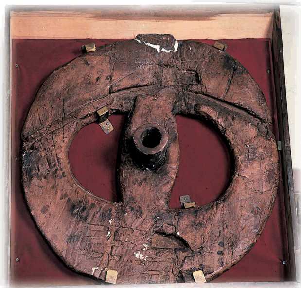
Calco della ruota lignea rinvenuta al Lagone Autore: M. Masini

I reperti rinvenuti ai Lagoni sono conservati presso il Museo Archeologico di Arona o il Museo delle Antichità di Torino.