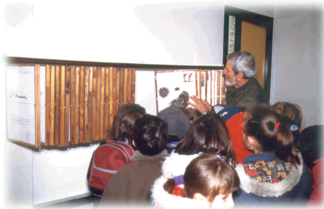
Cosultazione del "pennario" presso il Centro Visite