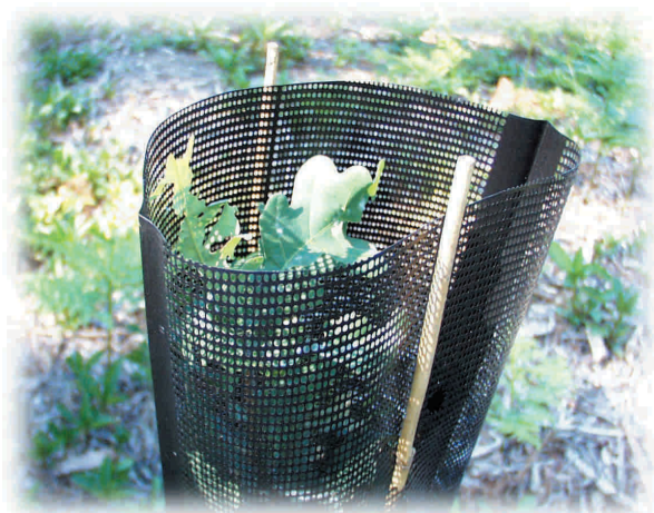
Piantina di farnia ( Oercus pedunculata ) in un'area rimboscita Autore: F. D'Amato

Il piano di assestamento forestale in un'area protetta ha come principali obiettivi l'analisi del patrimonio boschivo e la gestione naturalistica di questo. L'Ente Parchi controlla e guida l'utilizzazione del legname, favorendo il riavvicinamento della comunità vivente (biocenosi) all'equilibrio naturale. Attraverso un apposito programma di incentivazione viene favorito il coinvolgimento dei possessori e conduttori dei boschi nell'attuazione del piano di assestamento forestale.