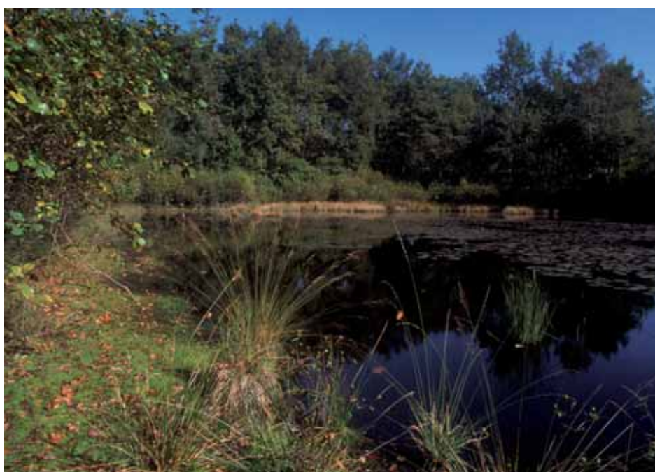
LAGHETTO "DELLE NINFE"

Per chi, come me, non crede che i Parchi siano strutture atte semplicemente a preservare, bensì dinamiche realtà che debbano anche promu-