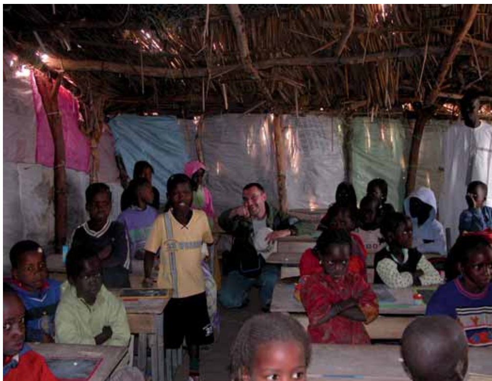
L'ENTE PARCHI IN SENEGAL

La fatica di lavorare per una Pubblica Ammini-