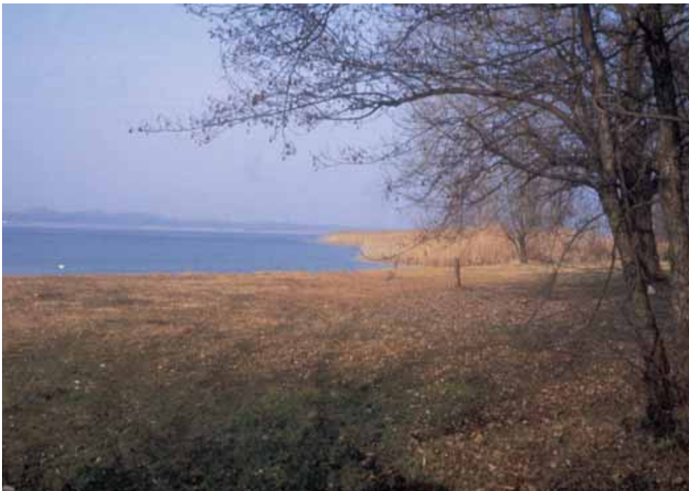
I CANNETI DI DORMELLETO

Scrivendo su queste pagine di che cosa custodirò con particolare cura nello zaino durante il "trasloco", avverto il rischio di rivelare quanto di più intimo ha caratterizzato il mio rapporto